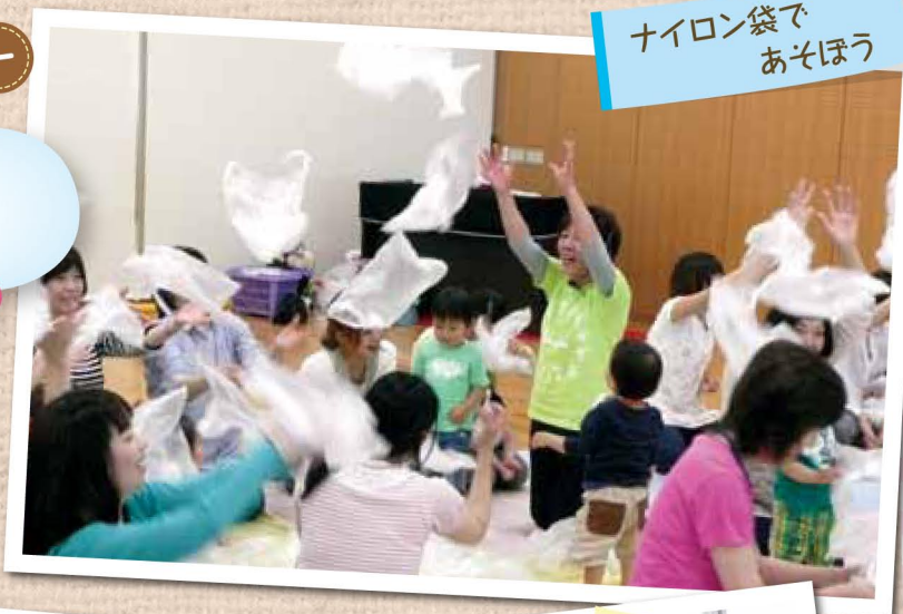
ナイロン袋であそぼう