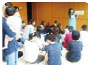
みどり図書館にて

福井市内には、「福井市立図書館・みどり図書館・桜木図書館・美山図書館・清水図書館」と「県立図書館」があり、各図書館では定例の「かみしばいといえほんのよみかかせ会」を行っています。このほかにも、福井市の図書館では昔話などを聞いて楽しむ「おはなし会」・「わらべうたを楽しむ会」や季節ごとの行事を、県立図書館では「おひざでだっこ会」や、子どもたちが楽しみながら学ぶ「かがくえほんの会」などを開催しています。