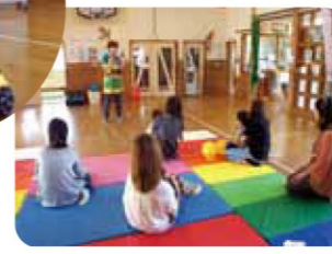
くろみ児童館にて

問い合わせ先 お近くの児童館 福井市社会福祉協議会 (児童館専用 ☎0776-26-2005)