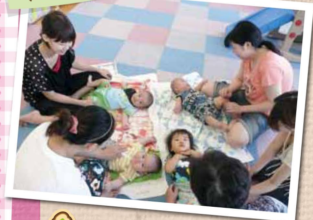
赤ちゃんも仲よし ママも仲よし